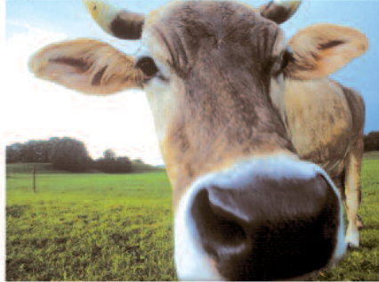
Laufwegen in Nesselwang

Mehr Infos im Internet www.nesselwang.de und www.laufarena.de